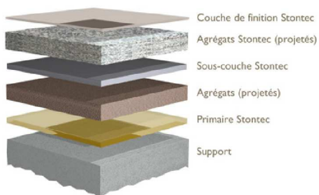
ERF | UTF | X P R E S S

La réalisation de coloris spécifiques est possible moyennant un délai et des quantités minimum.